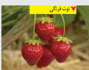
▼ توت فرنگی