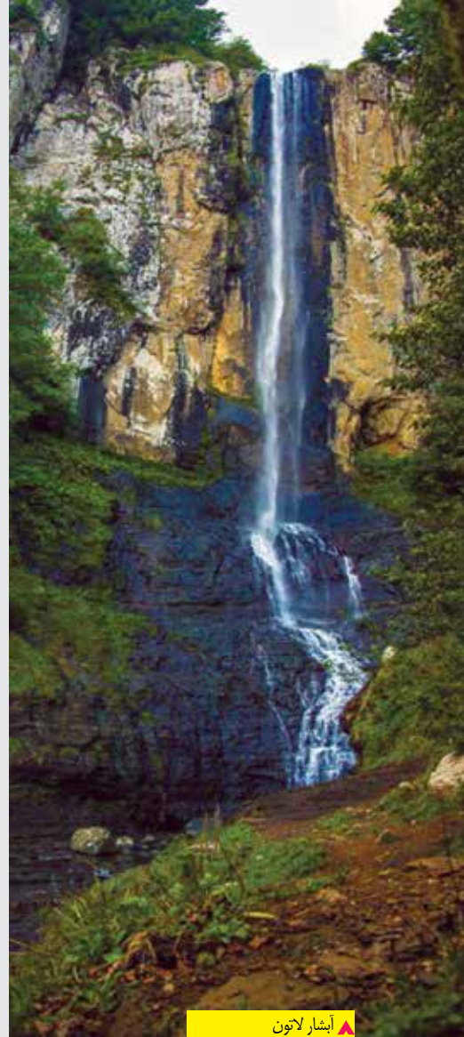
▲ آبشار لاتون