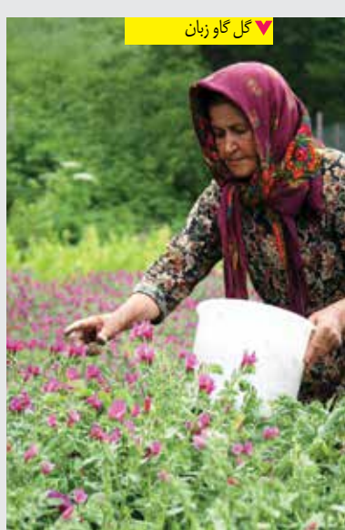
▼ گل گاو زبان