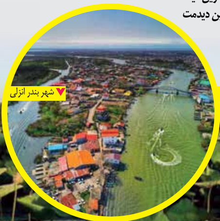
شهر بندر انزلی