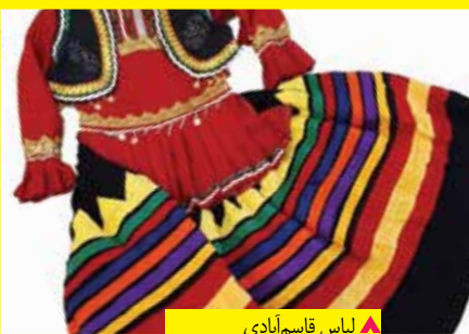
▲ لباس قاسم‌آبادی