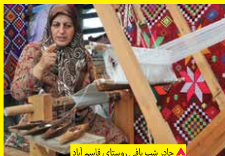
▲ چادر شب بافی روستای قاسم آباد