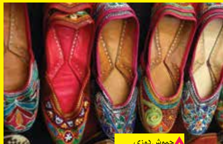
▲ چموش دوزی