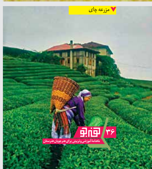
▼ مزرعه چای

مناسبی، به‌ویژه در شهرستان‌های شفت، لنگرود، آستارا، بندرانزلی و آستانه اشرفیه خواهند داشت.