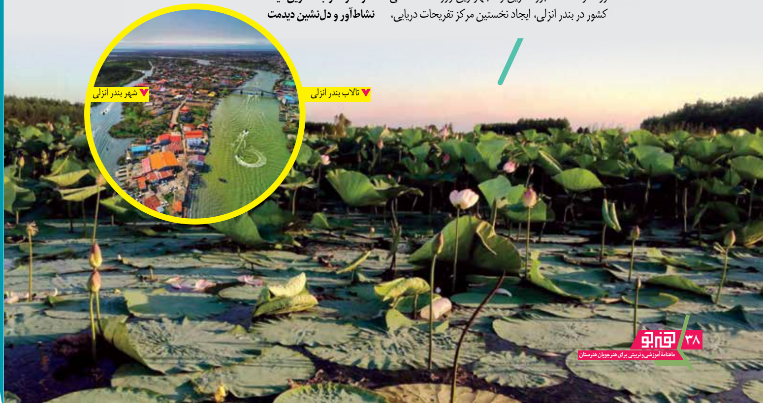
تالاب بندر انزلی