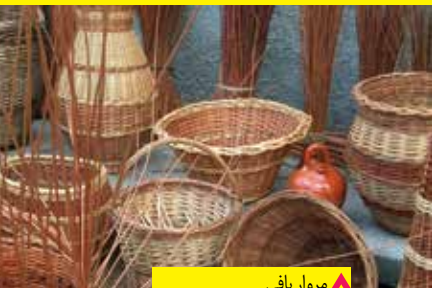
▲ مروار بافی