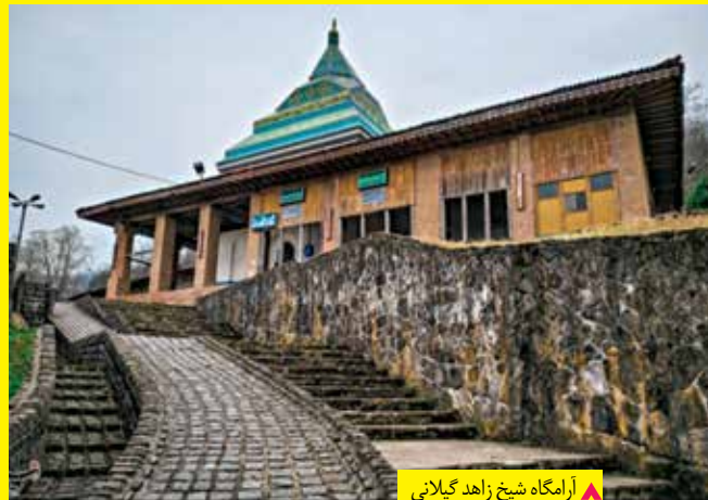
▲ آرامگاه شیخ زاهد گیلانی